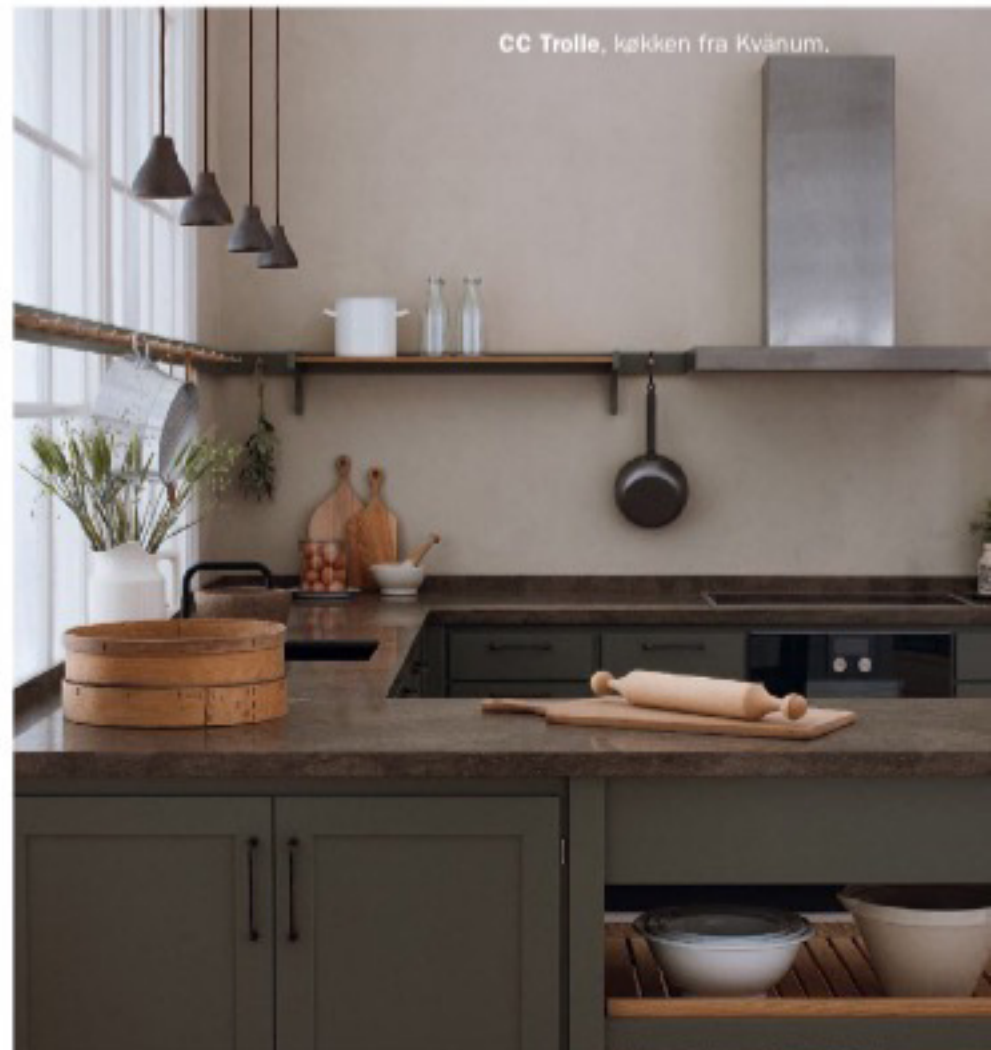
CC Trolle, køkken fra Kvänum.