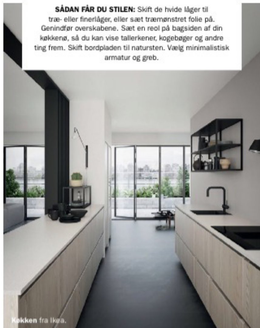
Køkken fra Ikøa.

SÅDAN FÅR DU STILEN: Skift de hvide låger til træ- eller finerlåger, eller sæt træmønstret folie på. Genindfør overskabene. Sæt en reol på bagsiden af din køkkenø, så du kan vise tallerkener, kogebøger og andre ting frem. Skift bordpladen til natursten. Vælg minimalistisk armatur og greb.