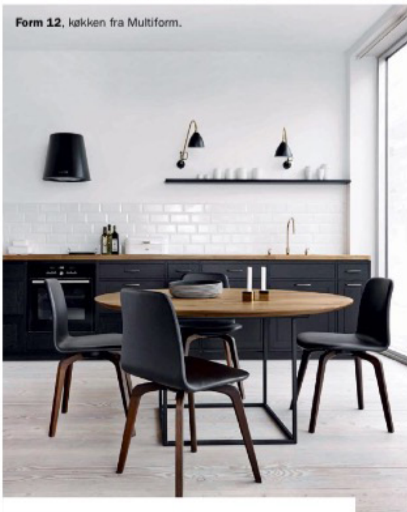
Form 12, køkken fra Multiform.