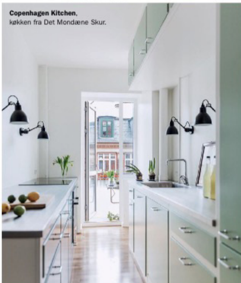
Copenhagen Kitchen, køkken fra Det Mondæne Skur.