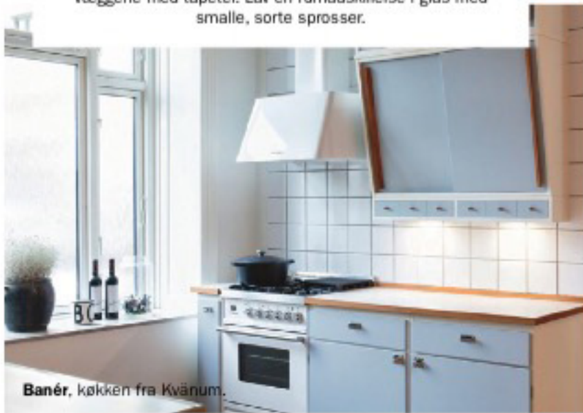
Banér, køkken fra Kvänum.

SÅDAN FÅR DU STILEN: Læg skakternet linoleum på gulvet. Gå på loppemarked efter en hylde med glasskuffer, der kan gemme mel, gryn etc. Brug pastelfarver. Skift bordpladen til stålplade med vulst (lille kant). Sæt kvadratiske 15 x 15 cm-fliser med knasfuge på væggen, eller dekorér væggene med tapeter. Lav en rumadskillelse i glas med smalle, sorte sprosser.