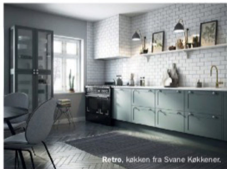
Retro, køkken fra Svane Køkkener.