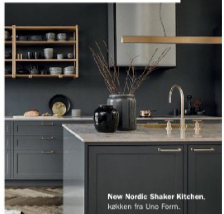
New Nordic Shaker Kitchen, køkken fra Uno Form.

SÅDAN FÅR DU STILEN: Køb et ekstra rullebord. Lad dine grydeskeer og andet værktøj stå fremme i store krukker. Skift greb og armatur til bruneret messing. Giv din træbordplade sort olie, eller skift den til røget eg. Gem de prangende køkkenmaskiner væk. Mal vægge og låger i støvede, mørke farver.